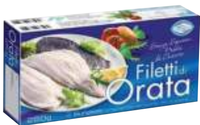
Filetti di orata 250g