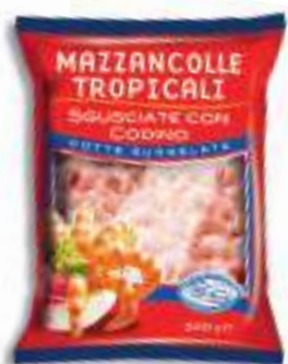
Maziancolle tropicali sgusciate con codino 300g