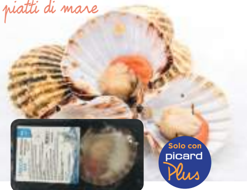
2 Cappesante mezzo guscio 160g

Un tocco di raffinatezza per i tuoi piatti di mare