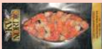
Code di gambero rosso indopacifico 240g